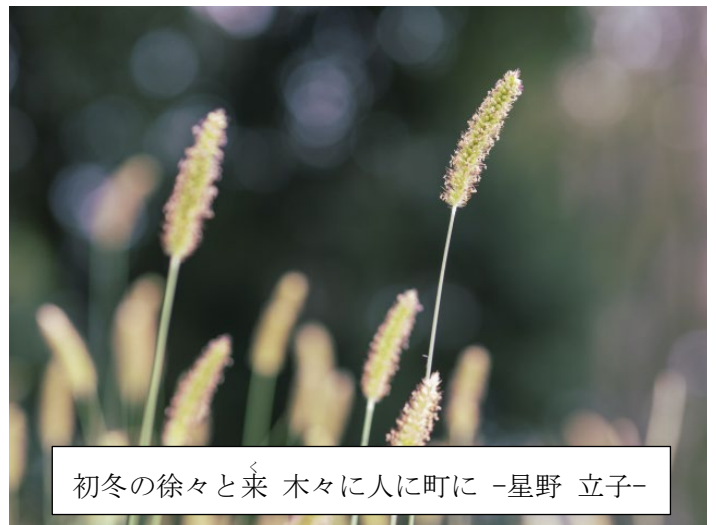
初冬の徐々と来 木々に人に町に -星野 立子-