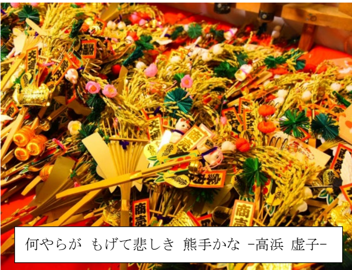
何やらが もげて悲しき 熊手かな -高浜 虚子-