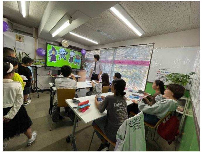
ラーニング・ワンの「理科実験教室・ハロウィンパーティー」