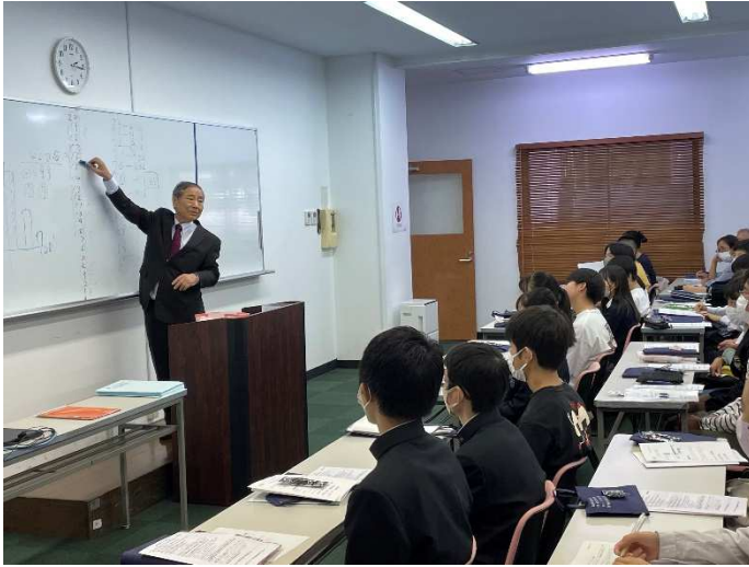
東京私塾協同組合主催の「スピーキングテスト練習会」