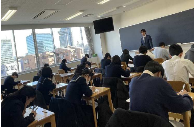
作文・小論文 集団討論練習会の様子です。