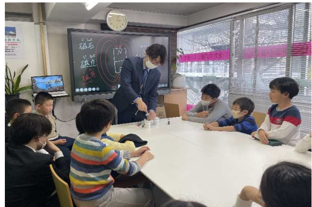
理科実験教室 磁石の仕組み・働き方等の実験。