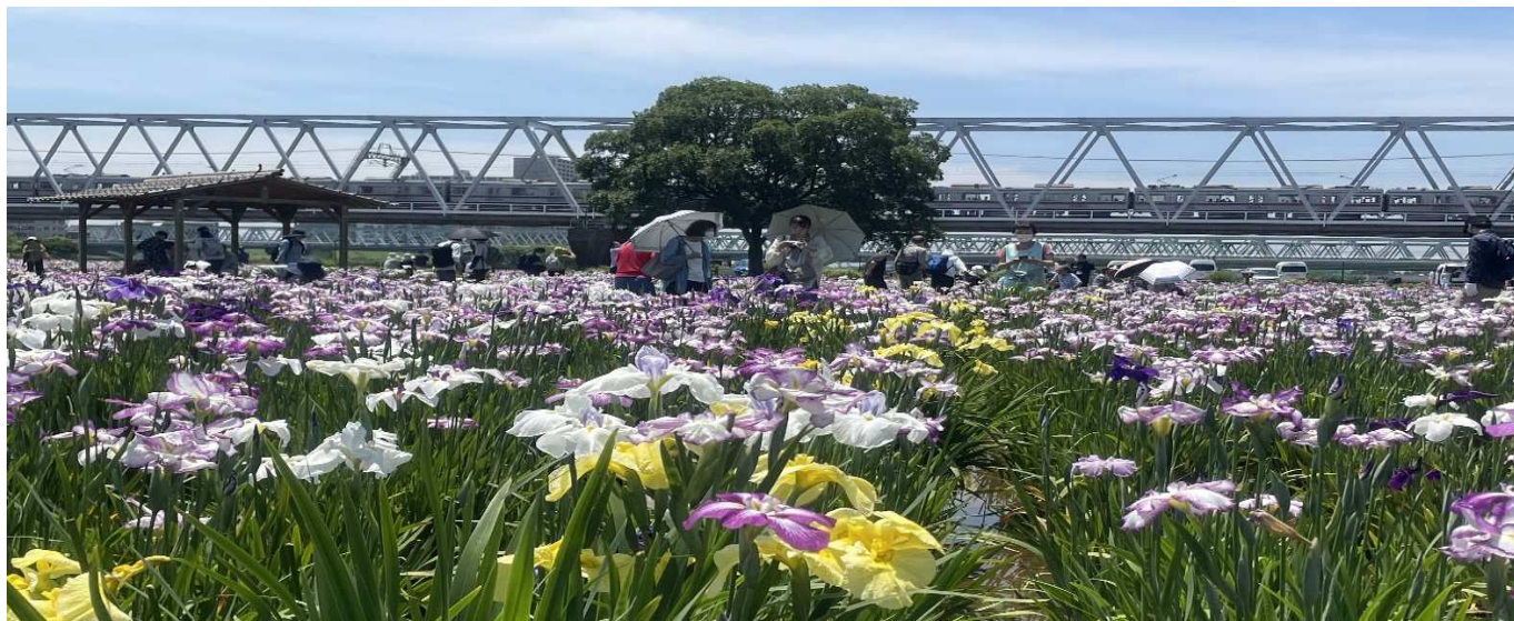
江戸川河川敷.小岩菖蒲園:100種5万本の花菖蒲の先に京成電鉄の鉄橋を走る電車が見えます。(6月11日)