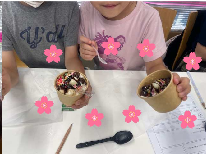
理科実験教室：塩？を使ってアイスクリームを作るぞ～！