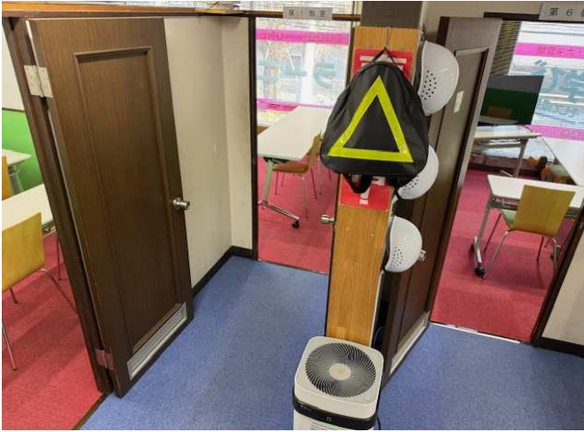
床タイルカーペットを新しく張替えました。ホール側・スカイブルー