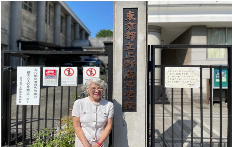
ラーニング・ワン塾長の学校訪問。都立上野高等学校、校長先生を訪ねました。